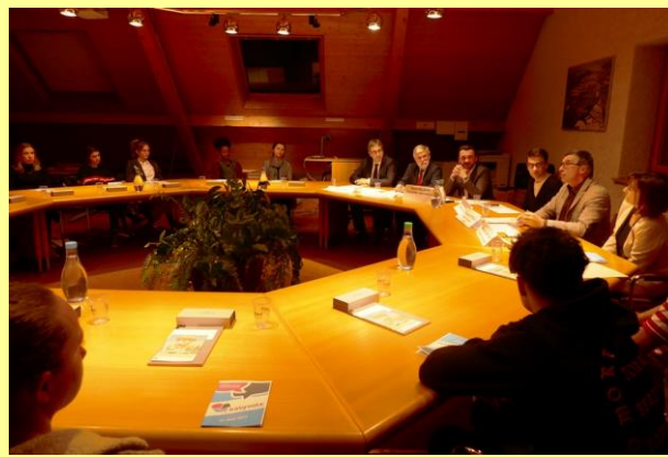
La salle du Conseil municipal, aussi remplie que lors d'une véritable séance !