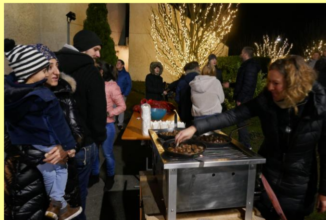
Marrons chaud au menu, préparés par la FASE.

Le Père Noël, dans sa hutte, a reçu tous les enfants. Chacun est reparti chez lui, des étoiles plein les yeux.